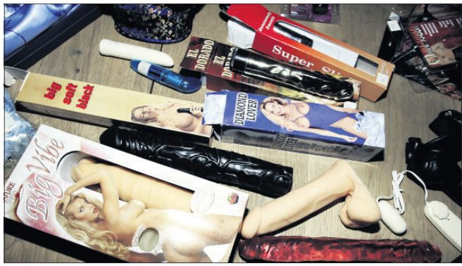
Gør-det-selv-sex med eller uden legetøj er noget, som mange kvinder må ty til, fordi deres mand har rejsningsbesvær. I dagens Danmark er det stadig et meget tyst-tyst-problem...